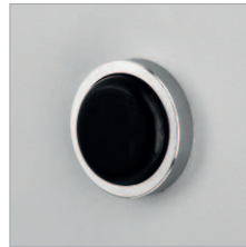
Edelstahlpuffer Schächer ES6015