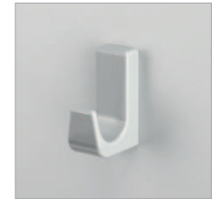
Nylonhaken Schächer N8010