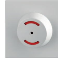
Aluminium- Einhandbeschlag INSAFE