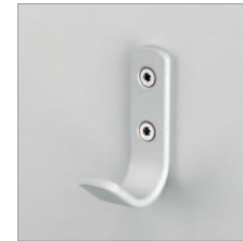
Aluminiumhaken Schächer AL7011