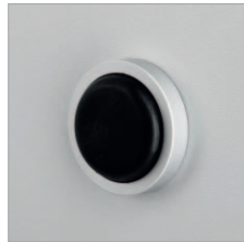
Aluminiumpuffer Schächer AL7015