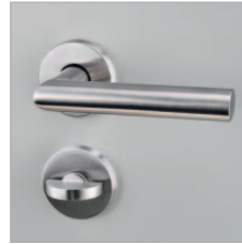
Edelstahl- Drückergarnitur Schächer ES6050