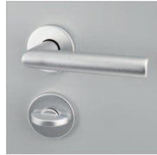
Aluminium- Drückergarnitur Schächer AL7050