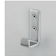
Edelstahlhaken Schächer ES6011